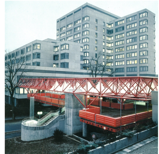
Blick auf Fussgängerebene und Kinderspital